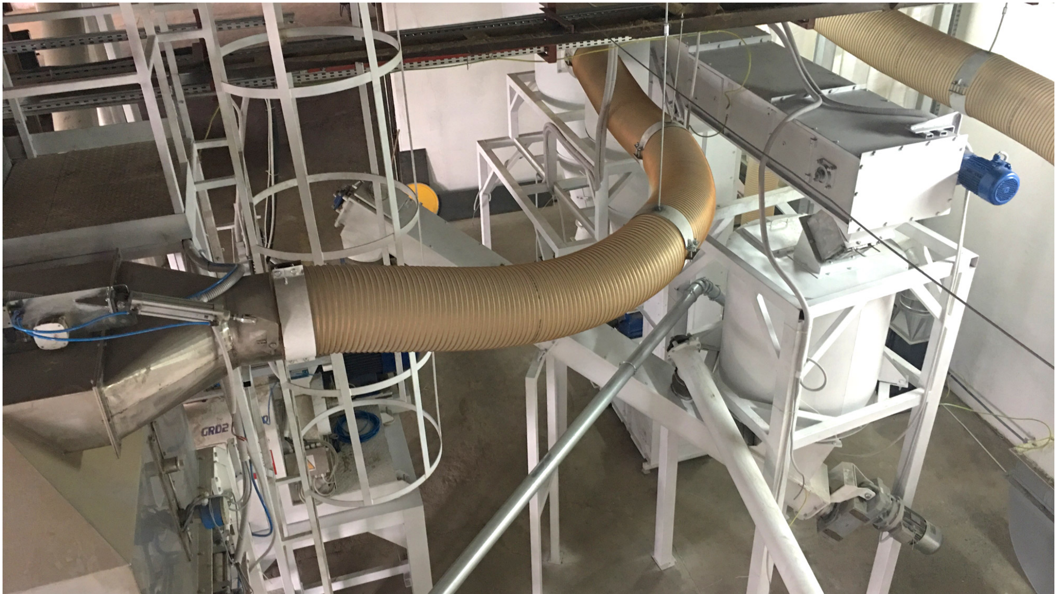
SYSTEM ASPIRACJI CHŁODNICY PRZECIWPŁĄDOWEJ (WAŻ ELASTYCZNY)