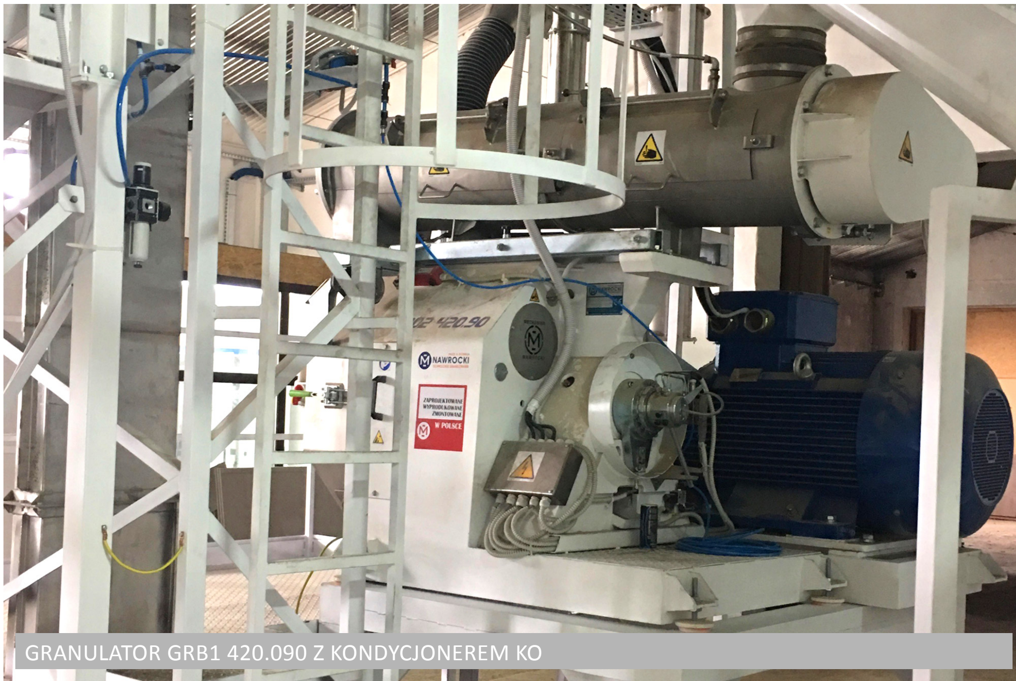
GRANULATOR GRB1 420.090 Z KONDYCYJONEREM KO