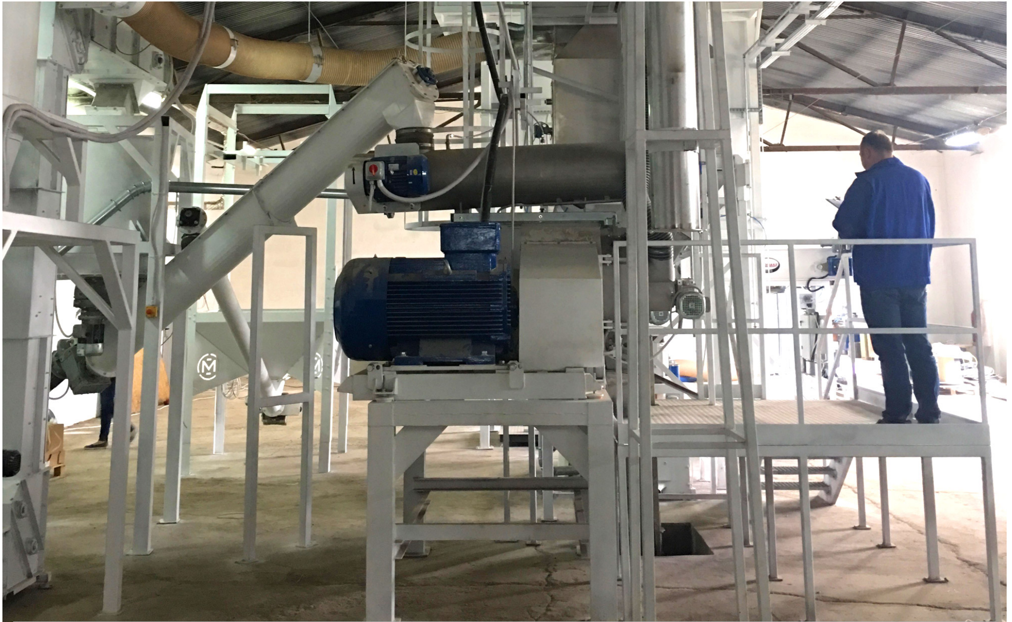
PODEST OBSŁUGOWY GRANULATORA GRB1 420.090 Z SYPEM DO PODNOŚNIKA KUBEŁKOWEGO