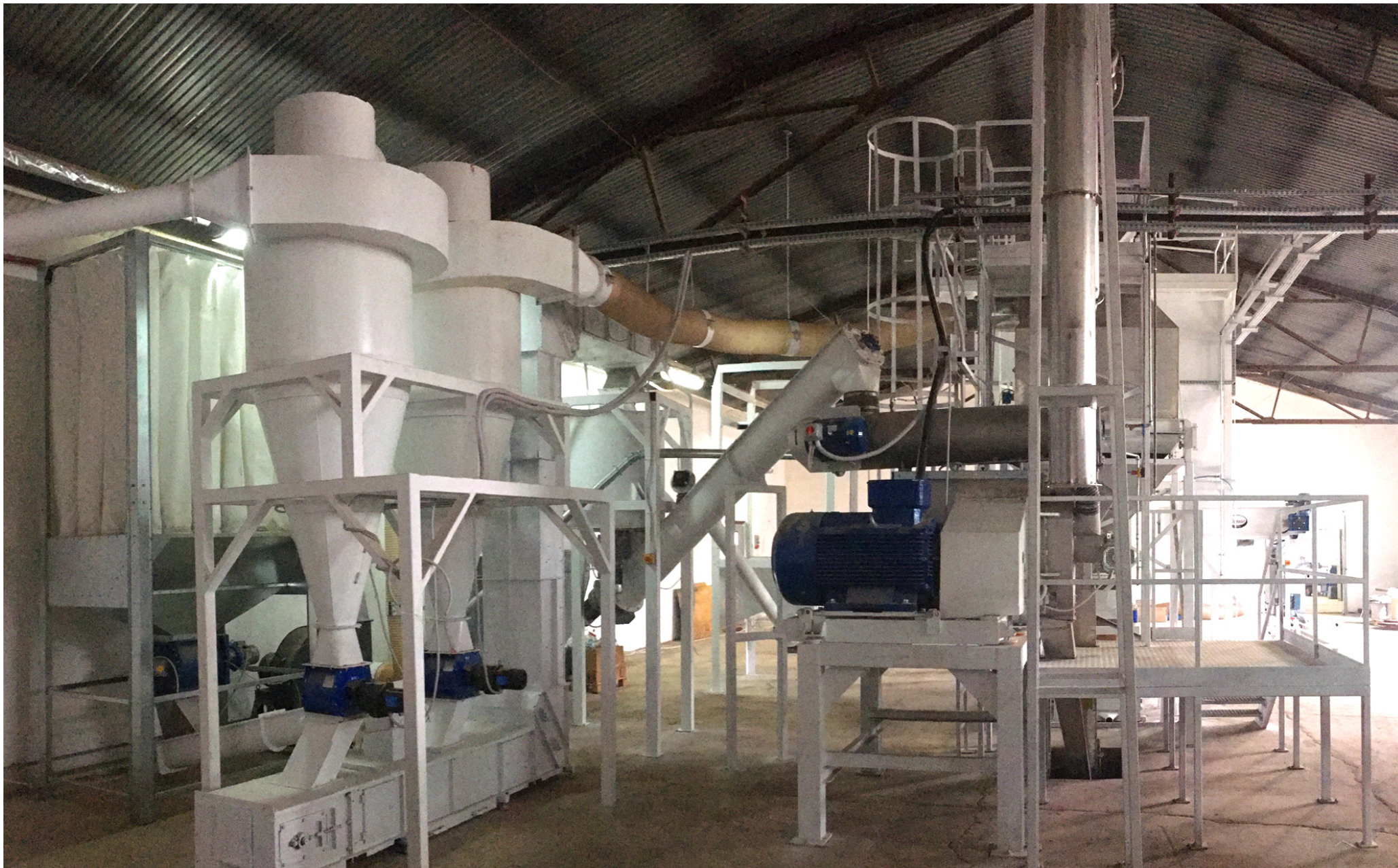
TRANSPORT PNEUMATYCZNY ZMIELONYCH TROCIN DO PODAJNIKA KUBEŁKOWEGO TYPU Z