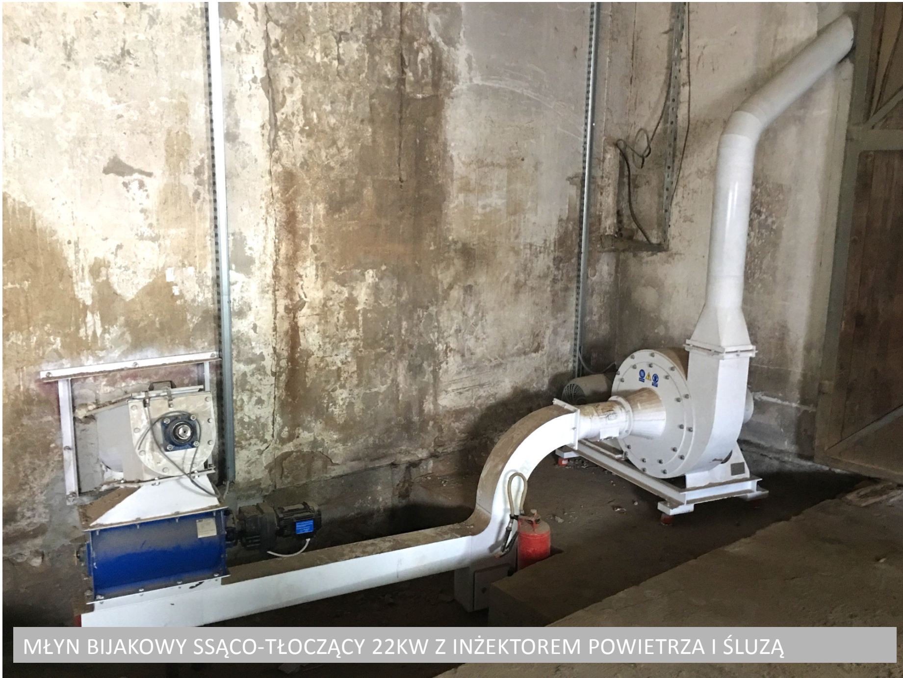
MŁYN BIJKOWY SSAĆCO-TŁOCZĄCY 22KW Z INŻEKTOREM POWIETRZA I ŚLUZĄ