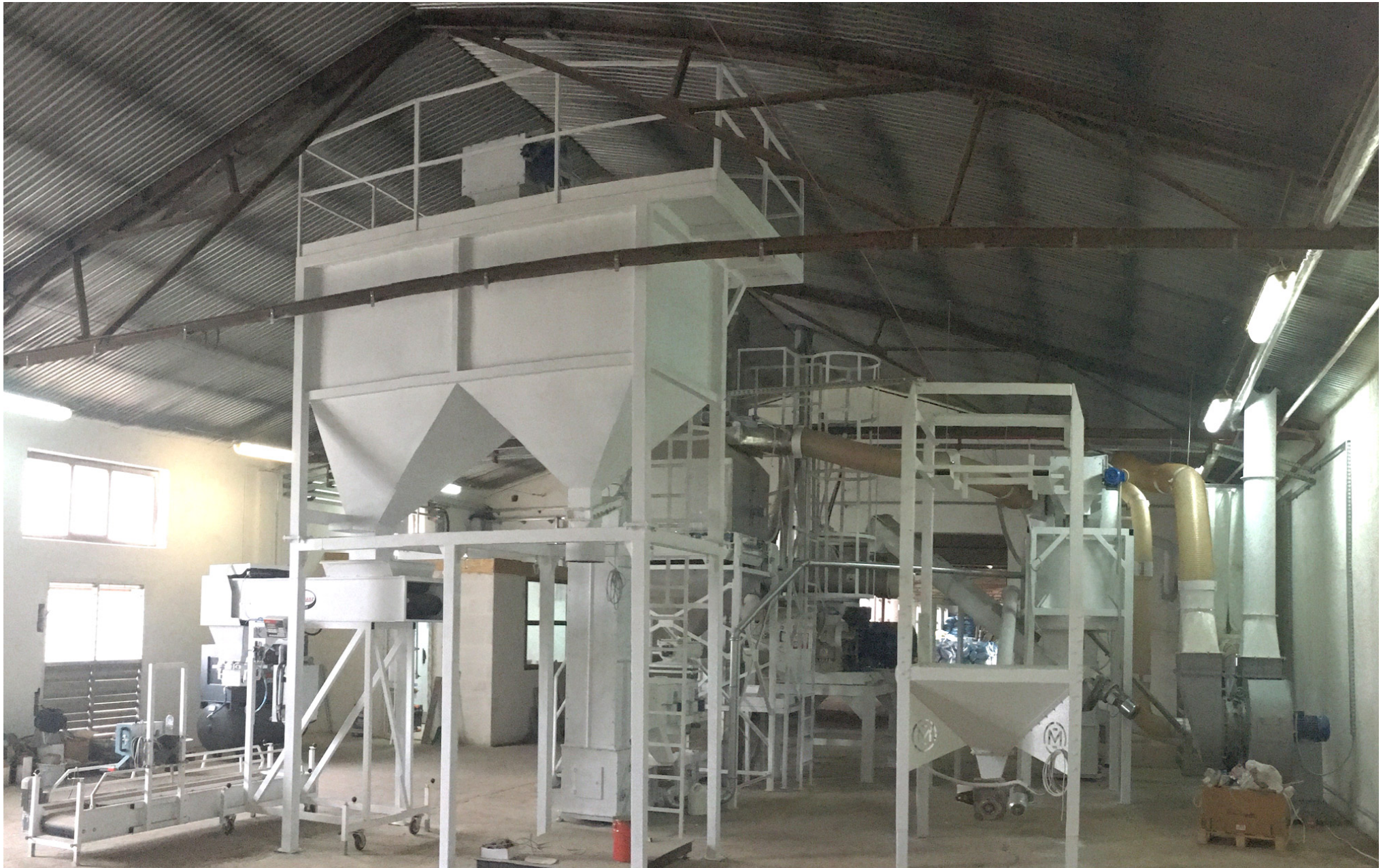
PODWÓJNY ZBIORNIK BUFOROWY WAGOPAKOWARKI Z WAGĄ PLATFORMOWĄ