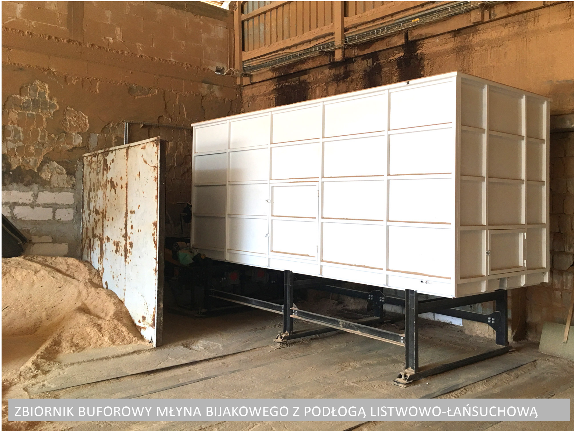
ZBIORNIK BUFOROWY MŁYNA BIJAKOWEGO Z PODŁOGĄ LISTWOWO-ŁAŃSUCHOWĄ