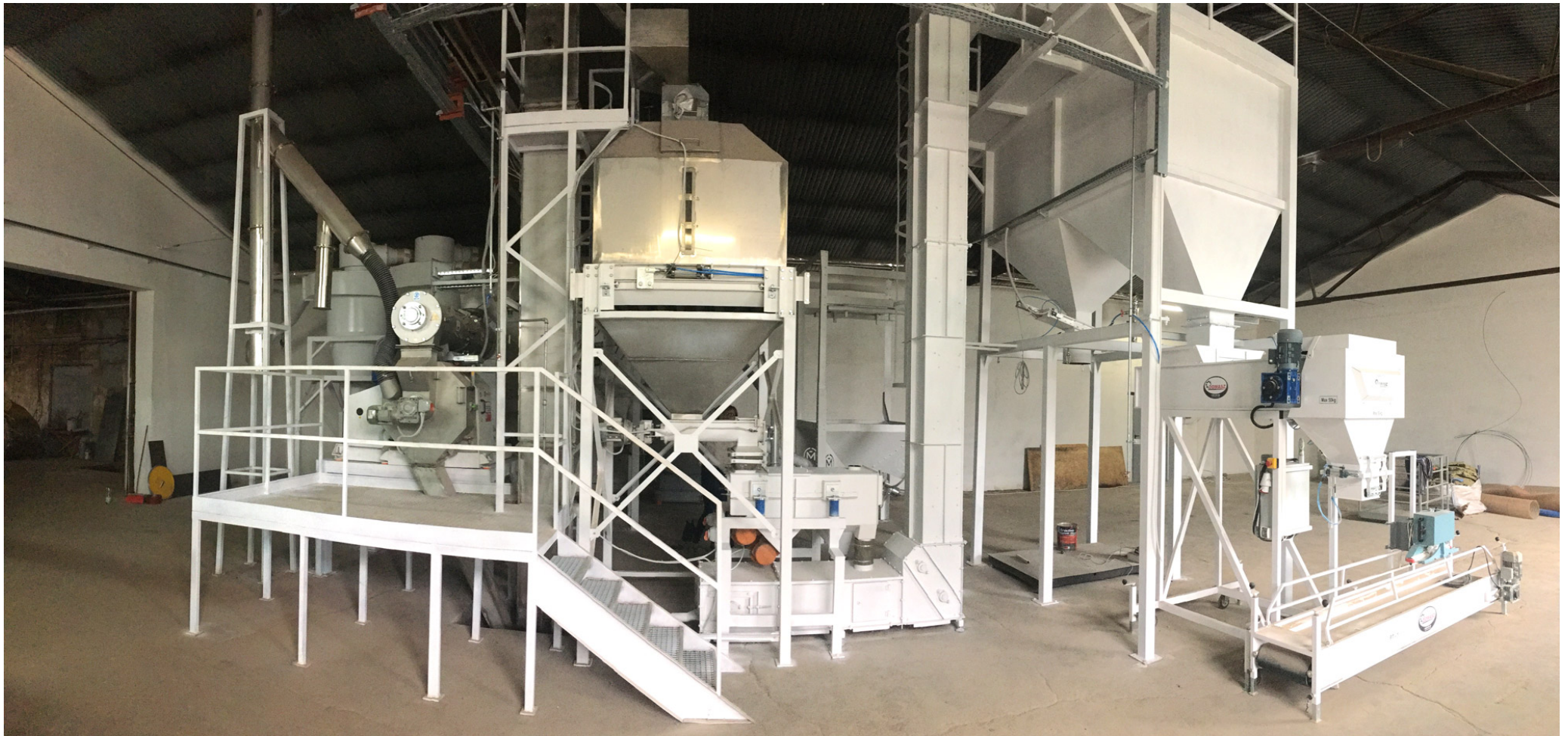
FABRYKA PELLETÓW (0,8 – 1,0 t/h), MATRYCA FI420, MOC 90KW