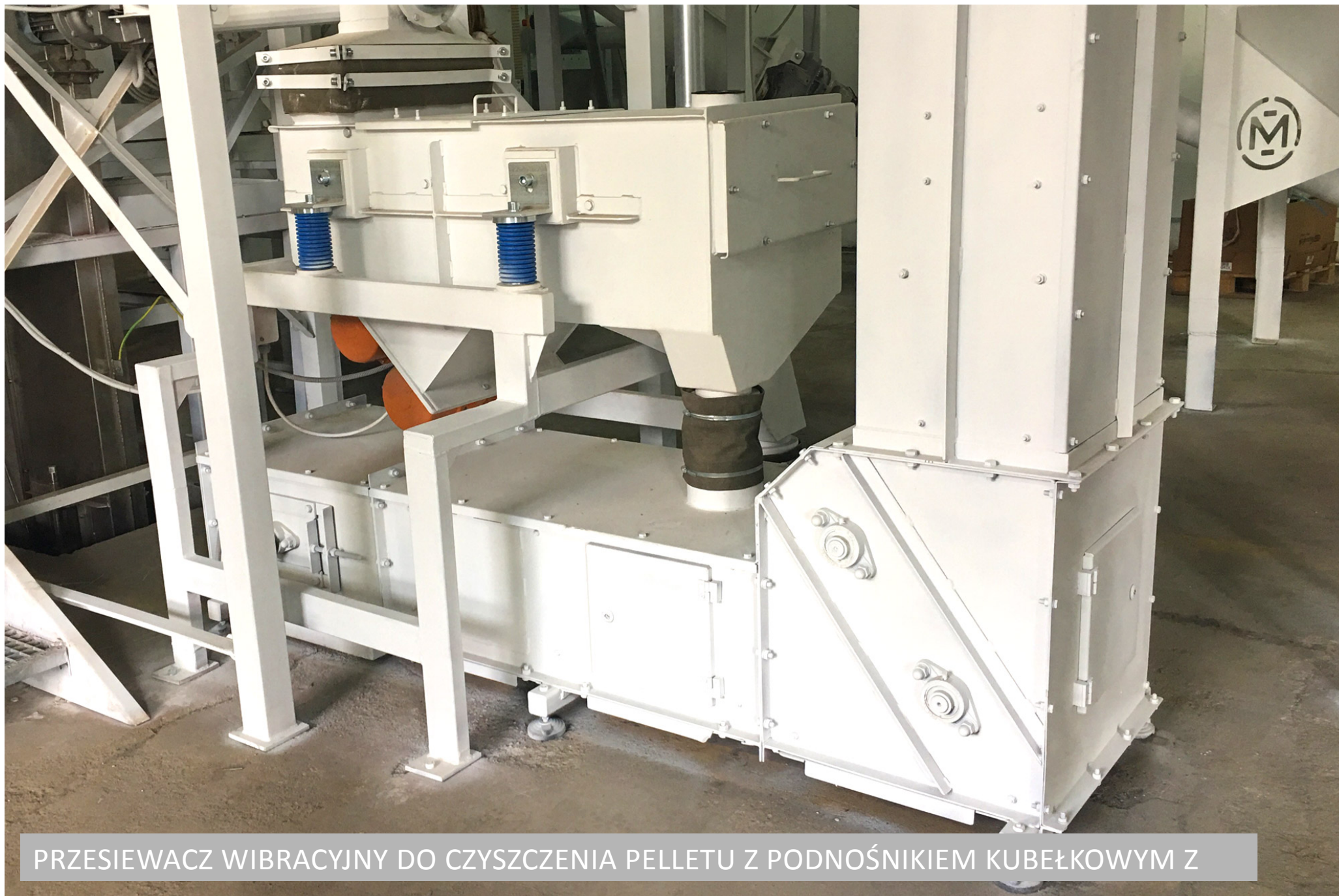
PRZESIEWACZ WIBRACYJNY DO CZYSZCZENIA PELLETU Z PODNOŚNIKIEM KUBEŁKOWYM Z