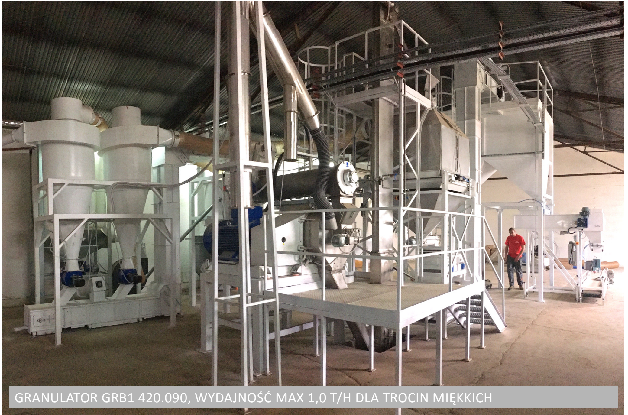
GRANULATOR GRB1 420.090, WYDAJNOŚĆ MAX 1,0 T/H DLA TROCIN MIĘKKICH