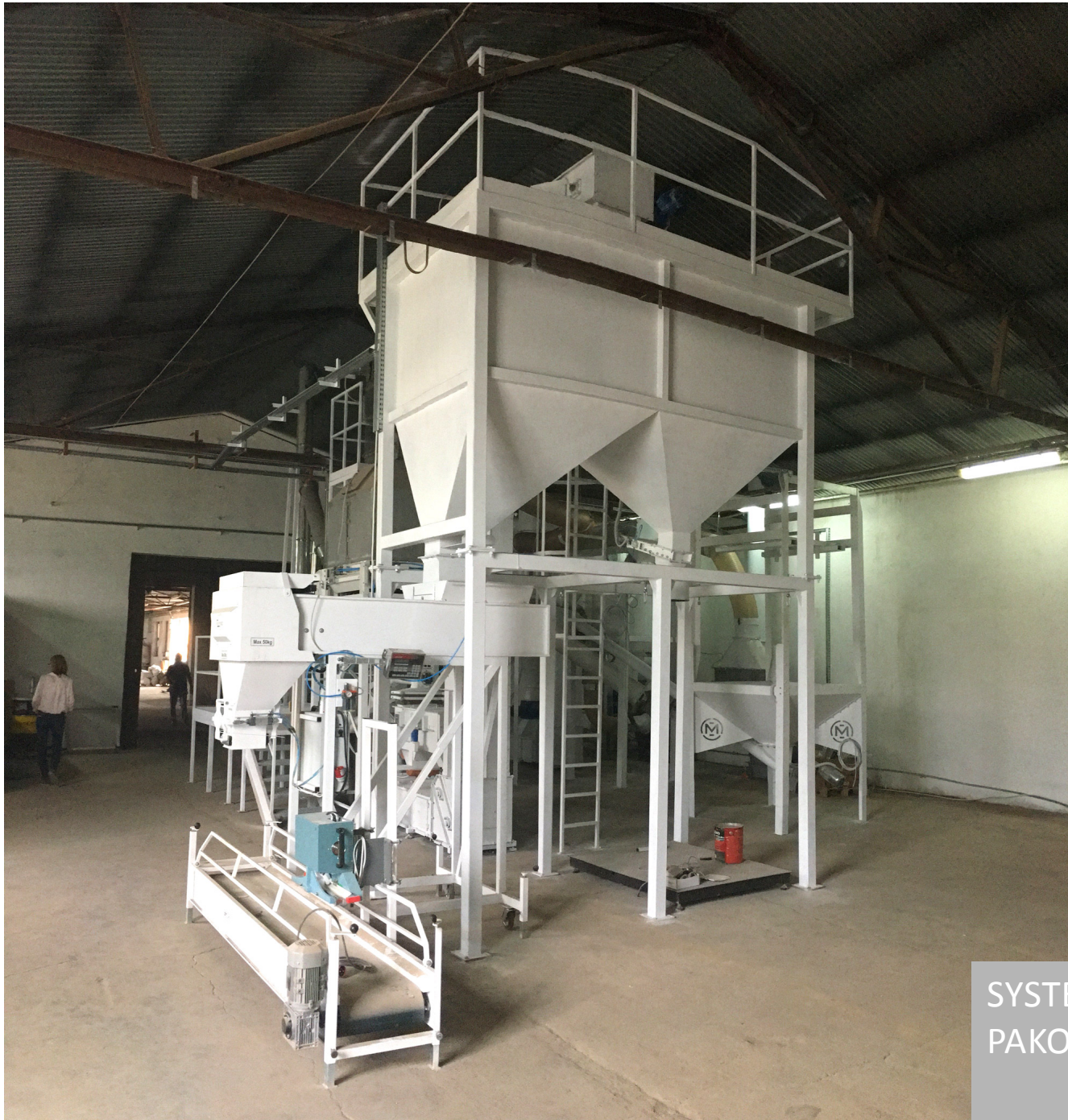
SYSTEM PÓŁAUTOMATYCZNEGO PAKOWANIA W WORKI 15KG I BIG-BAG